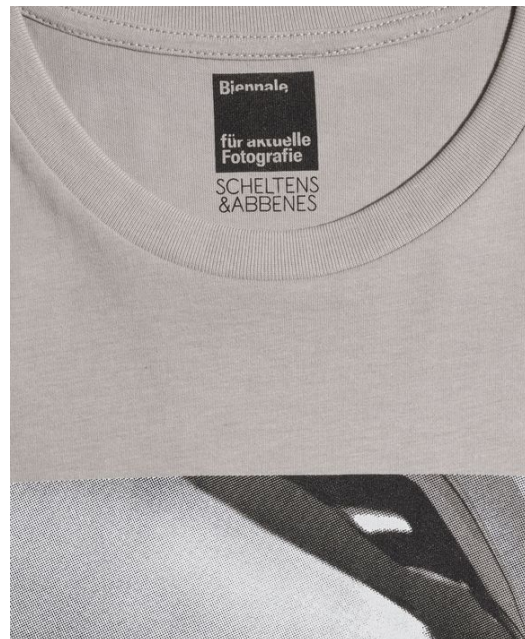
Scheltens & Abbenes, Fantastic Man, Irony, Buttons , 2012