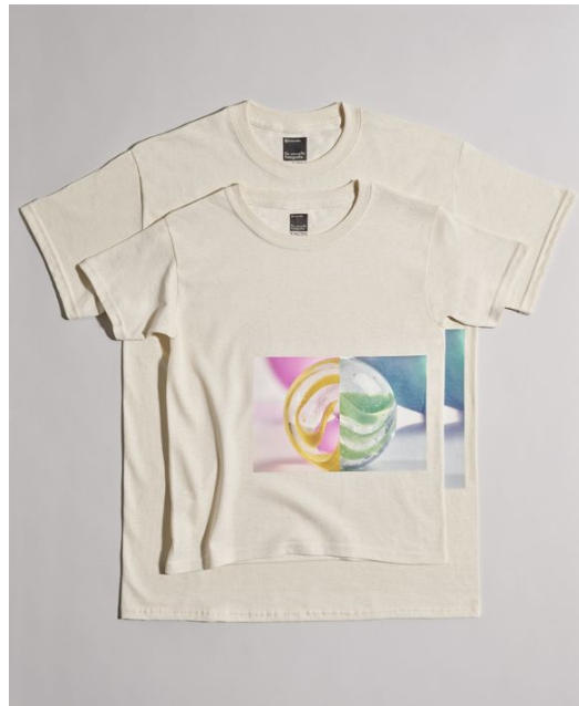
Scheltens & Abbenes, MacGuffin Magazine, The Ball 4 , 2018